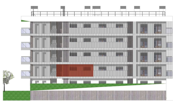
Alçado Poente 1:100