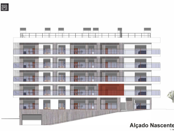
Alçado Nascente 1:100