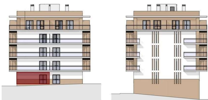
Alçado Norte / Alçado Sul