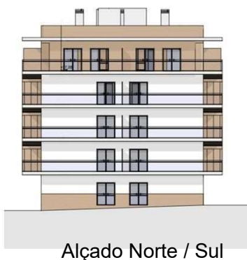
Alçado Norte / Sul