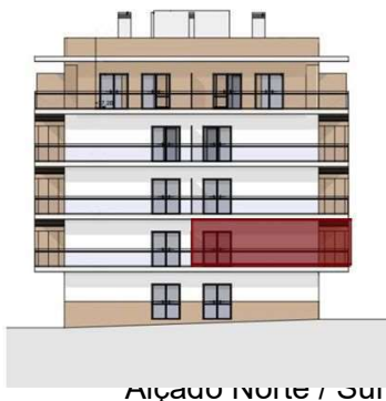
Alçado Norte / Sul