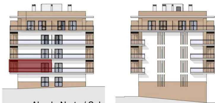
Alçada Norte / Sul